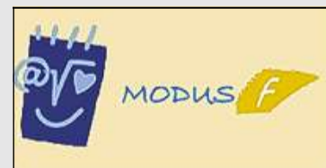
„Modus F“: Unter diesem Logo läuft das von der Wirtschaft unterstützte Modellprojekt.

reiches Hilfsmittel, um die Bemühungen zur Qualitätsverbesserung in der ganzen Breite der Schule wirksam werden zu lassen, so dass sie bei allen Schülern ankommen. Von der Teilnahme am Modell verspricht er sich, dass die begonnene Praxis einer Führungsstruktur an der Schule zu einer allgemein ak-